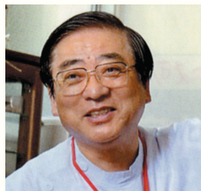
社会医療法人 玄真堂 理事長 川 寫 眞 人

心からくつろいで、快適な療養生活を送って 頂けるよう、理想の施設づくりを目指します。 職員たちは、まごころを持って働きますので よろしくお願ひ申し上げます。