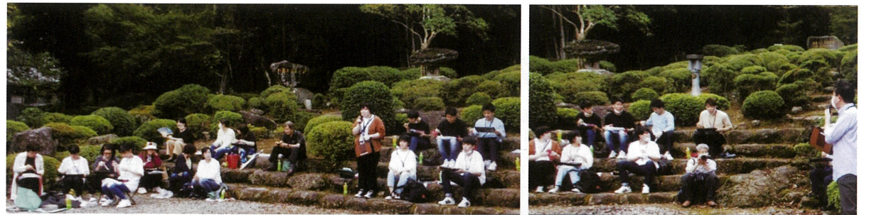
⑥⑤④、③②とも新入職員 30 人全員が自己紹介をし、理事長が 75 年前の八面山の出来事を話し、ハッキリとした口調で感想を述べた新入職員たち