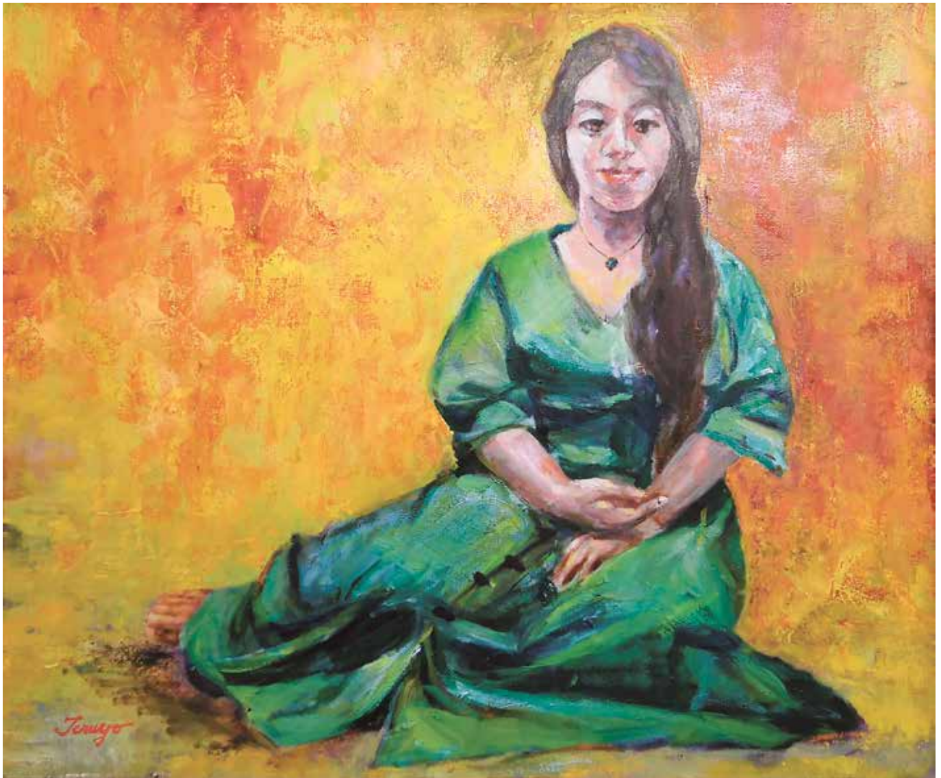
『緑衣の女（ひと）』川島 照代画

編集・発行:社会医療法人玄真堂 広報委員会:宝珠山理絵、畑辺恵美 中津市宮夫14-1 TEL0979-24-0464 http://kawashimahp.jp