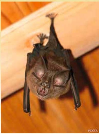
キクガシラコウモリ

特に麻疹や天然痘はコロナブスのアメリカ発見以来、ヨーロッパから中南米や南アメリカに移動したことでインカ帝国などの崩壊につながった事がわかってきている。