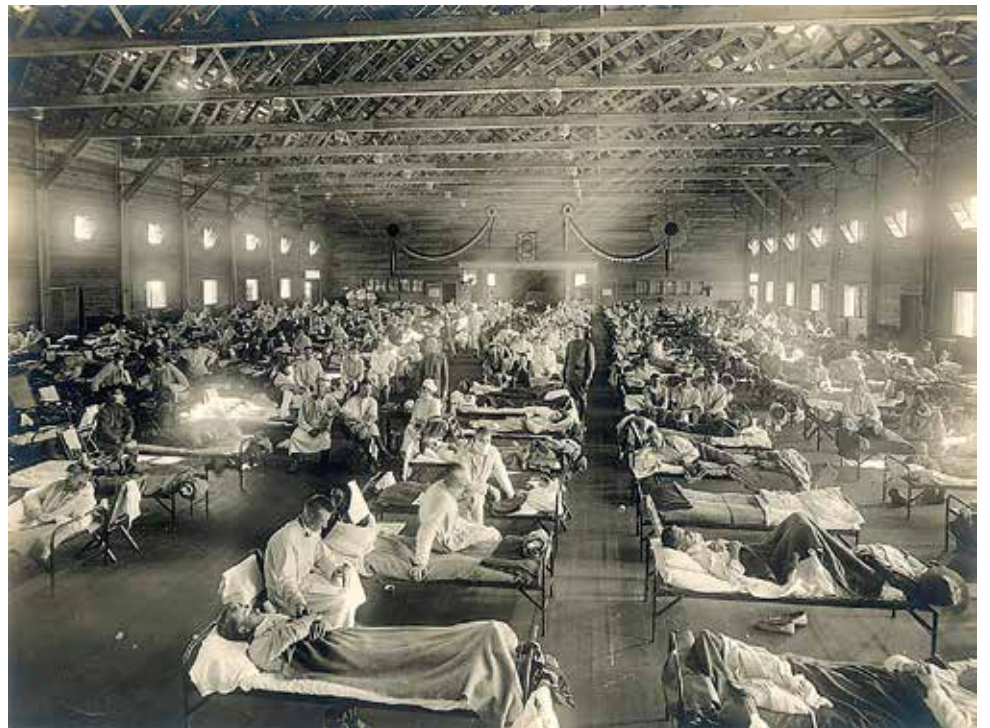
スペイン風邪1918年_米国カンザス ファーストン基地

日本においても多くの感染者があり、大きな数の犠牲者が出たと伝えられている。このスペイン風邪のの流れを見ると第1次で25万人、第2次で12万人、第3次では3,698人、合計38万人が死亡している。このようなパンデミックが3回にわたり起こってきたという事を考えると、今後、新型コロナウイルスが、今はとりあえず落ち着きつつあるようだが、いつ第2次、第3次感染が起こってくるかわからないので十分な警戒を怠ってはいけない。